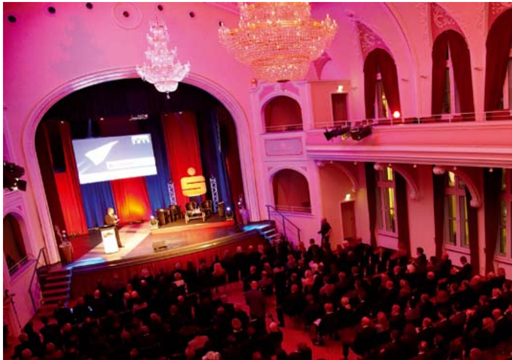
Oben: Rund 450 Gäste verfolgten die Preisverleihung im Goldsaal der Schauburg Iserlohn.